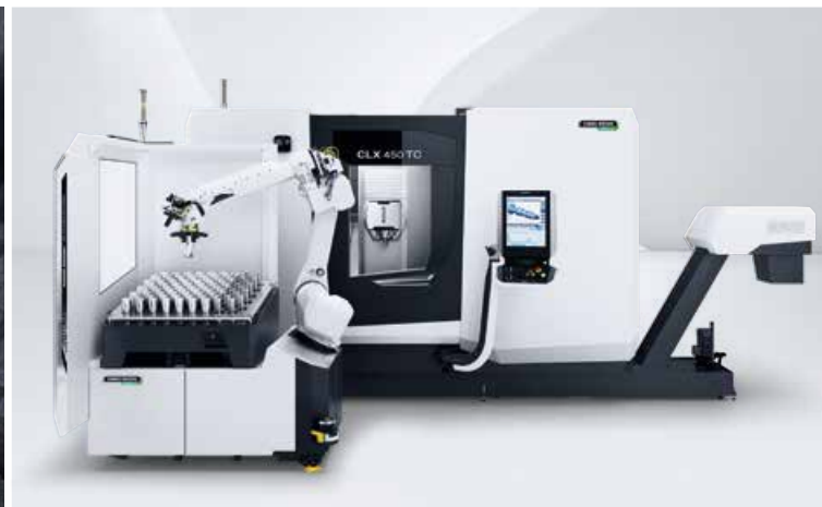
CLX 450 TC s Robo2Go