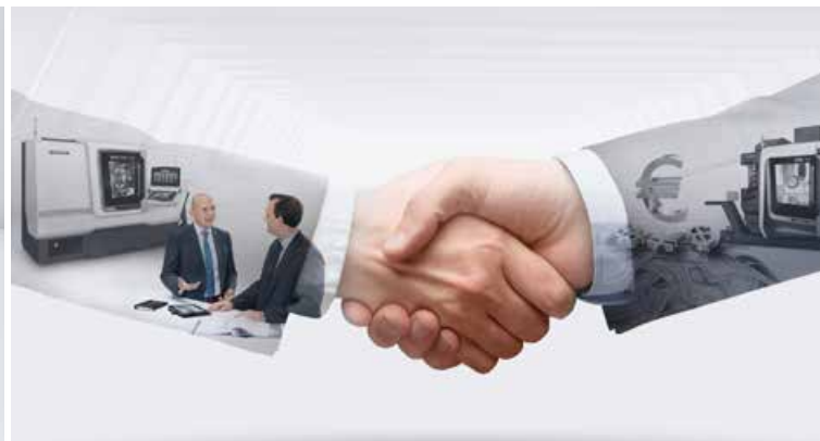
DMG MORI FINANCE možnosti různých financování strojů