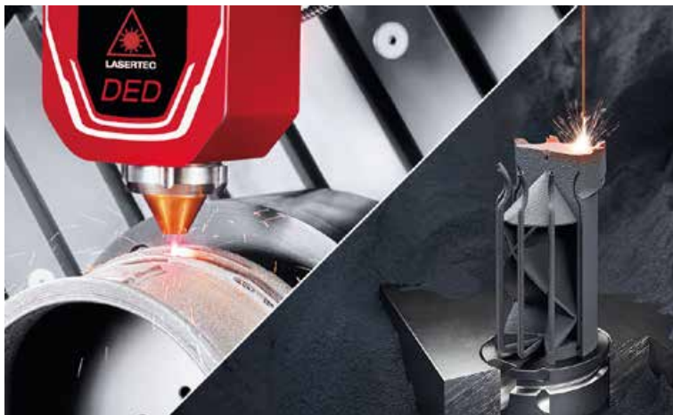
DMG MORI ADDITIVE LASERTEC SLM 2 ND GENERATION