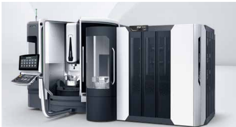
DMU 65 monoBLOCK s PH CELL Automation